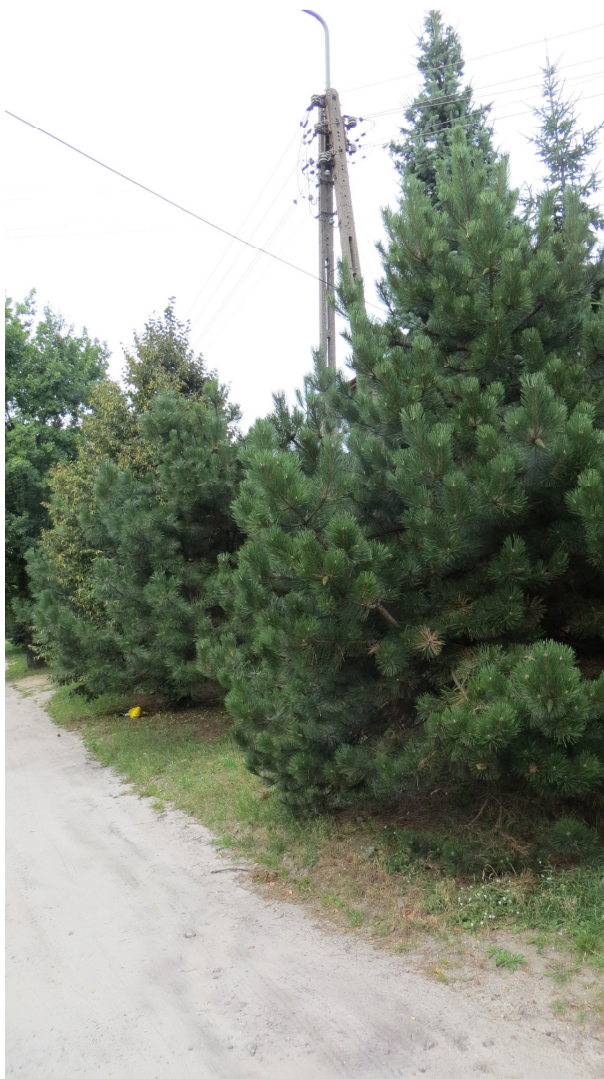
Fot. 5 Od prawej: drzewa nr 10, 11