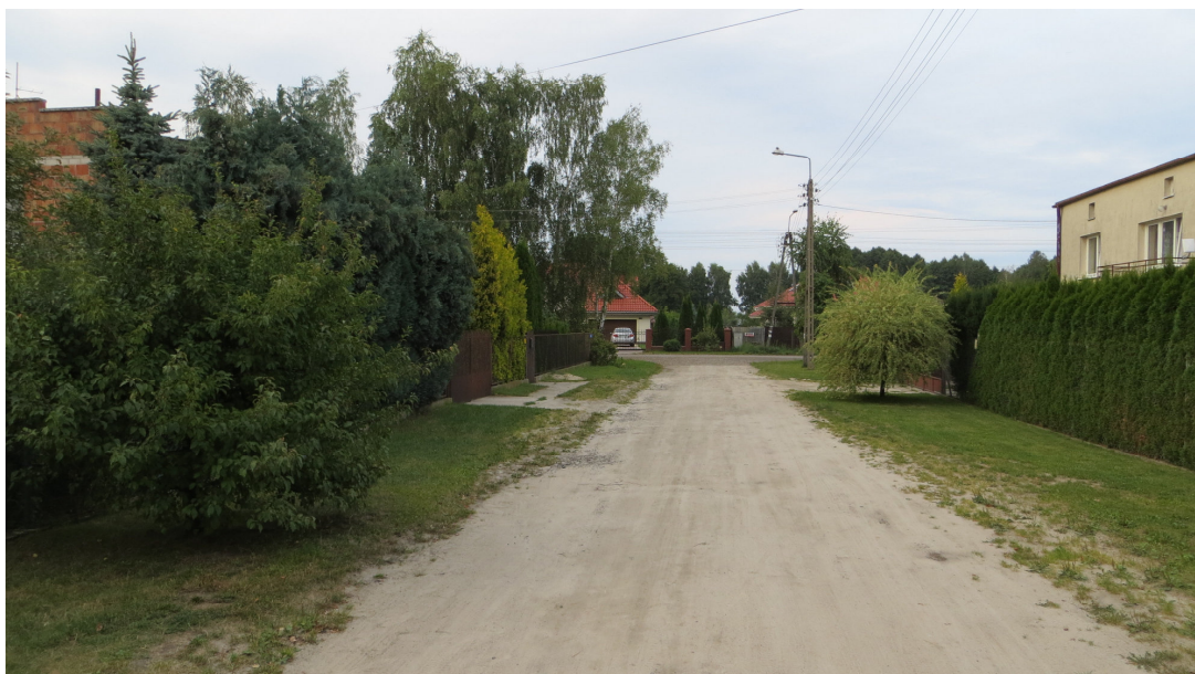
Fot. 20 od lewej: drzewo nr 32 oraz 33 (po prawej stronie)