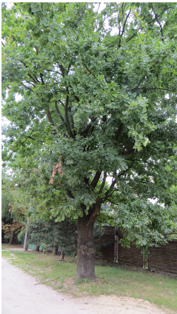
Fot. 8 drzewo nr 15