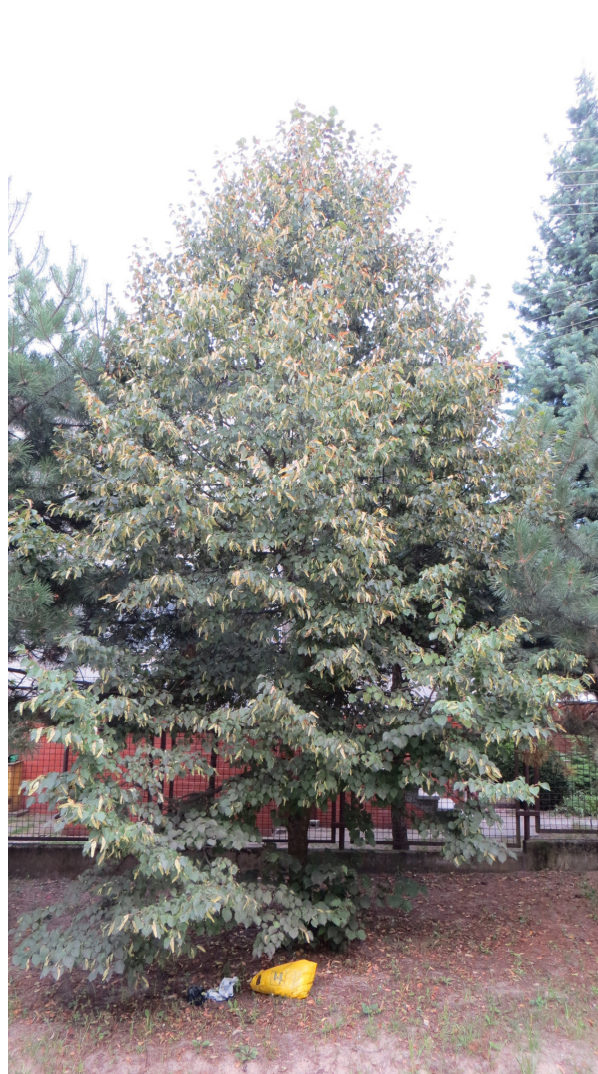
Fot. 6 drzewo nr 12