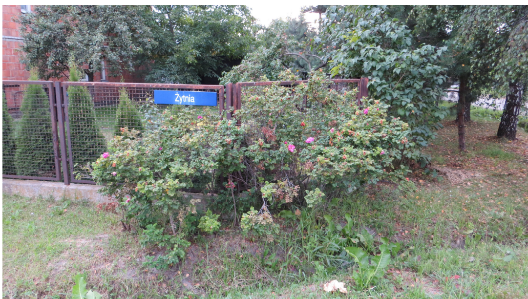
Fot. 21 krzew nr 34