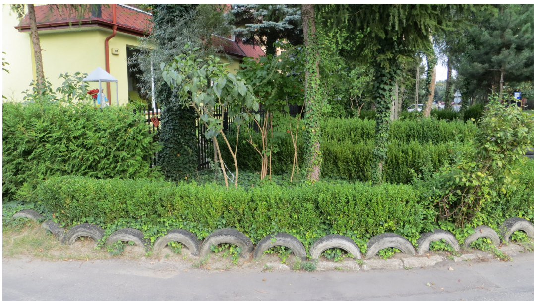
Fot. 2 Krzewy nr 6