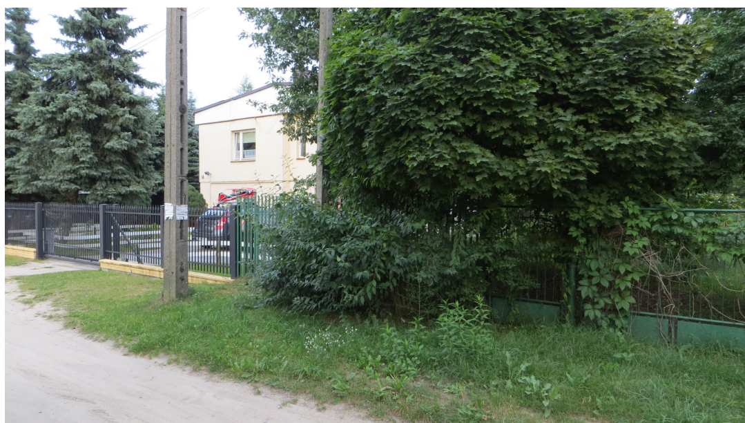
Fot. 16 krzew nr 26