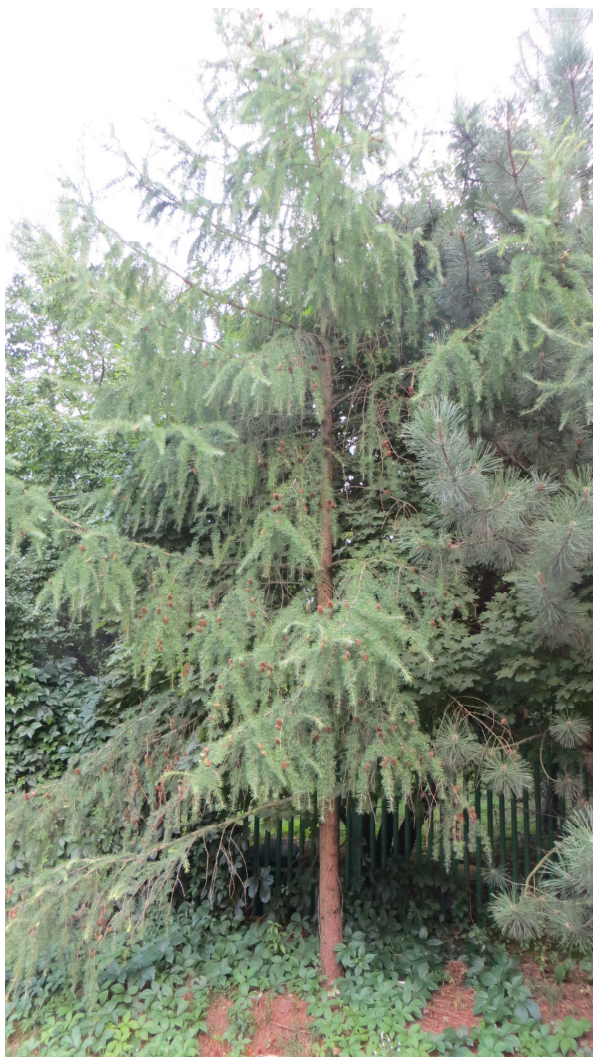
Fot. 15 drzewo nr 25