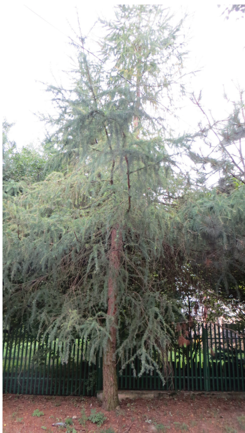
Fot. 13 drzewo nr 23