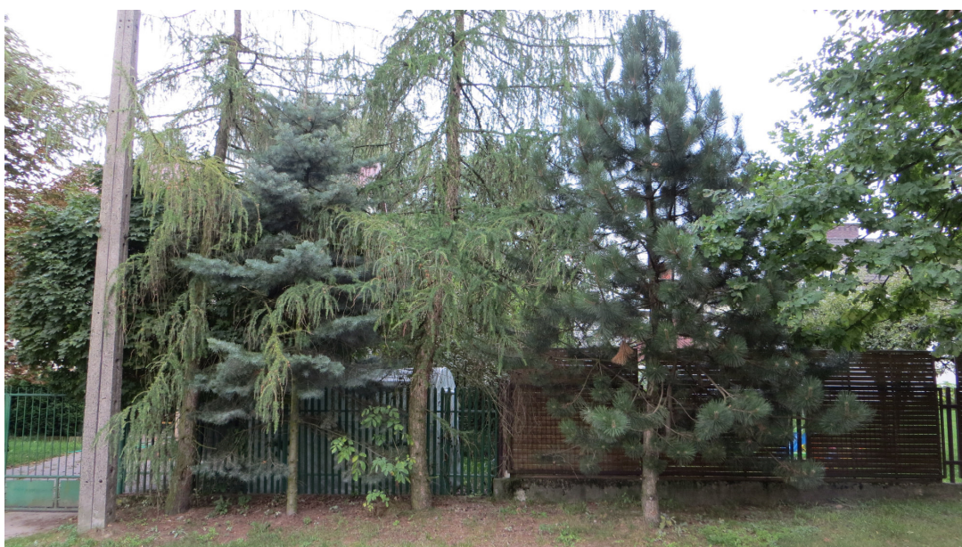
Fot. 9 Od prawej: drzewa nr 16, 17, 18, 19