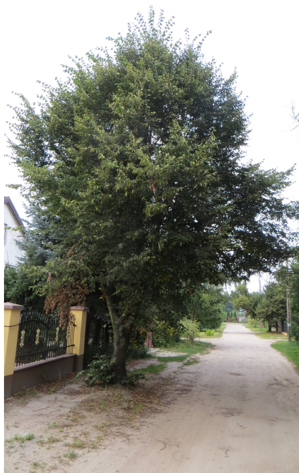
Fot. 17 drzewo nr 27