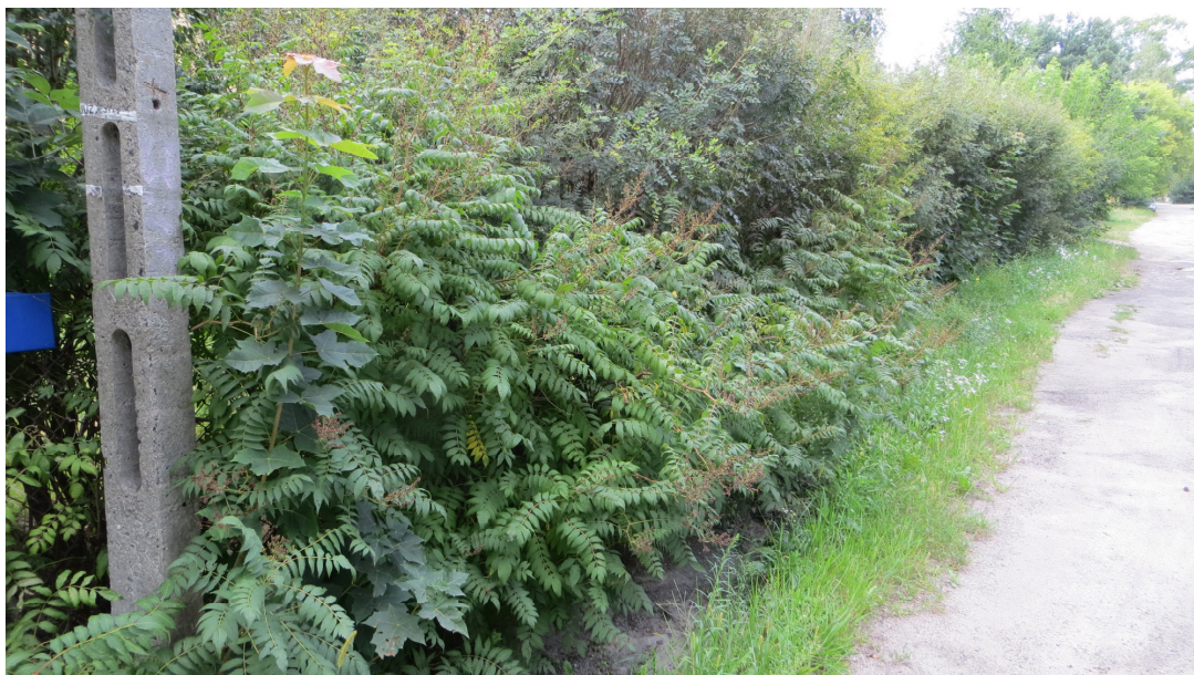
Fot. 3 Krzewy nr 7