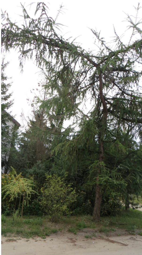
Fot. 18 od lewej: drzewo nr 28, krzew nr 29, drzewo nr 30