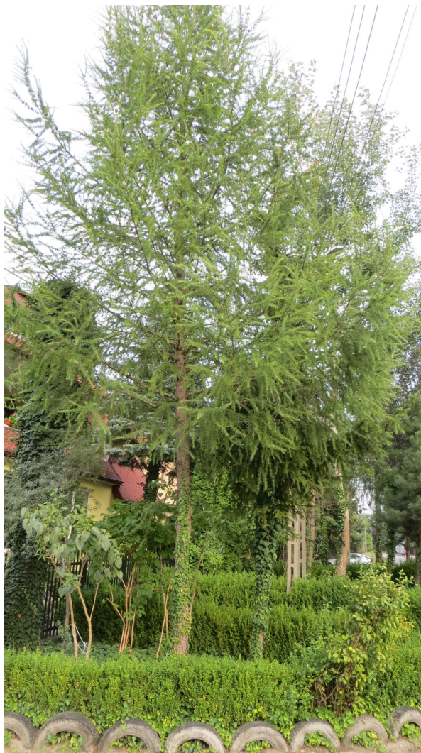
Fot. 1 Od lewej: drzewa nr 3, 4, 5, 1, 2