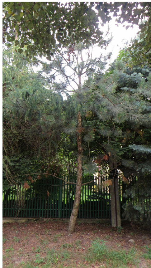
Fot. 12 drzewo nr 22