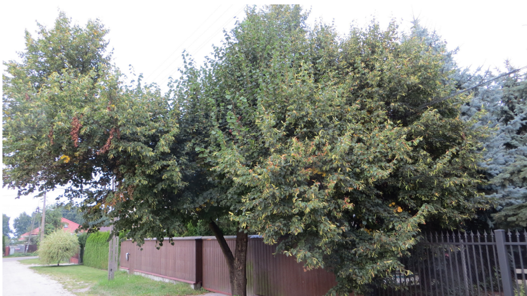
Fot. 19 drzewo nr 31