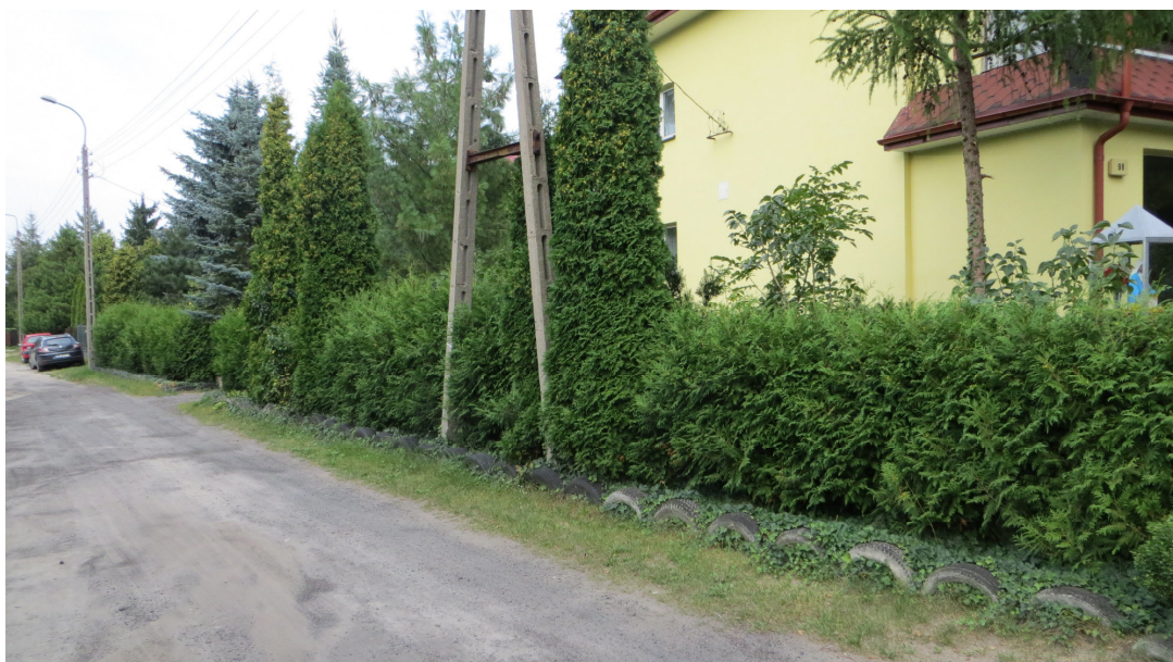
Fot. 4 Od lewej: Krzewy nr 9, 8