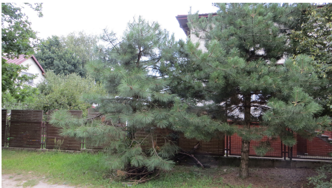
Fot. 7 Od prawej: drzewa nr 13, 14