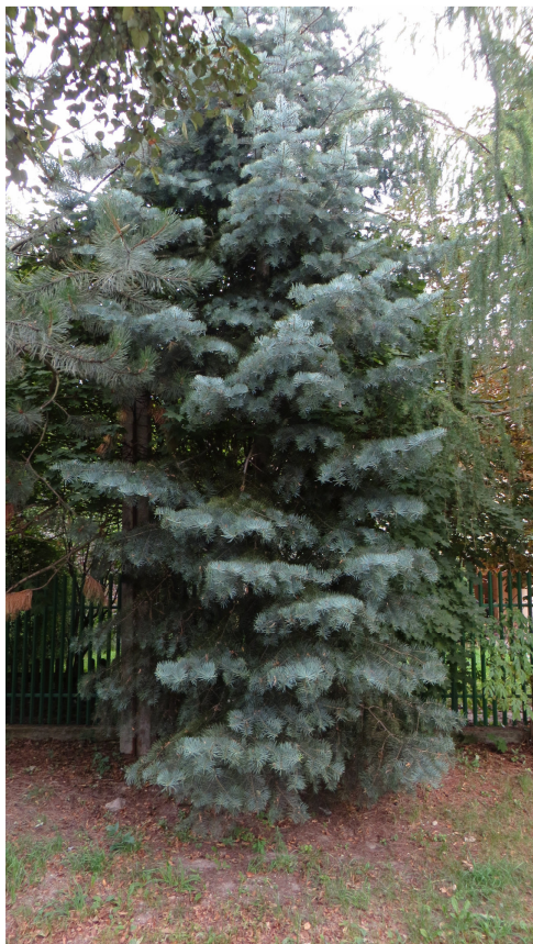
Fot. 11 drzewo nr 21