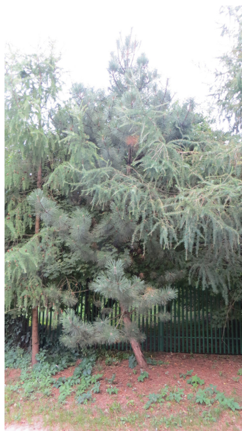
Fot. 14 drzewo nr 24