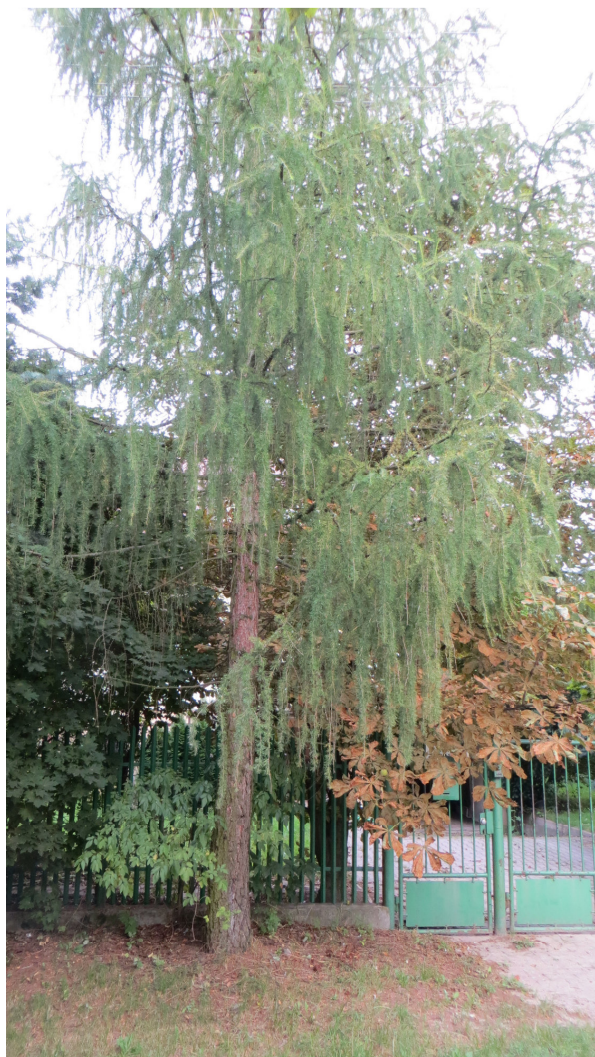
Fot. 10 drzewo nr 20