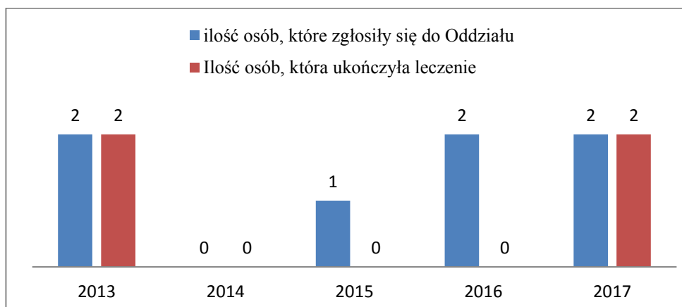
Wykres nr 4. Ilość osób, które zgłosiły się do Dziennego Oddziału Terapii Uzależnienia od Alkoholu i Współuzależnienia, oraz liczb osób, która ukończyła leczenie.

Źródło: dane pochodzące z Mazowieckiego Specjalistycznego Centrum Zdrowia im. prof. Jana Mazurkiewicza w Pruszkowie.