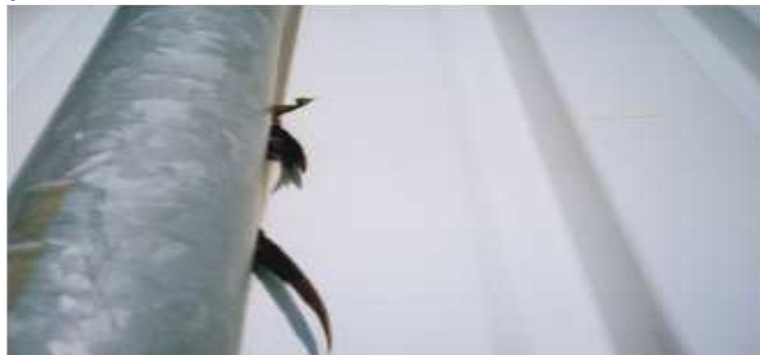
Uwięzione ptaki za rynną spustową

Rynny spustowe posadowione są we wklęsłej części blachy falistej. W większości przypadków przylegają one do niej szczelnie. Jednakże są też rynny (blok przy ul. Dębowej 8 i 8A), które w górnej części (poziom 4 - tego piętra) odchylają się nieco na zewnątrz tworząc pionowe szczeliny między rynną a blachą. Ptaki wpadając w taką szczelinę zsuwają się w dół i pozostają tak zaklinowane na zawsze. Najczęstszym powodem wpadania ptaków za rynny spustowe jest to, że usiłują się one dostać do otworu wokół rynny w miejscu, gdzie wchodzi ona w okap. Ponieważ nie jest to łatwy wlot ze względu na jego usytuowanie często od wewnętrznej strony rynny oraz w związku z faktem, że wokoło nie ma żadnych „chwytnych” powierzchni - jest tylko blacha, ptaki wpadają w śmiertelną pułapkę za rynną.