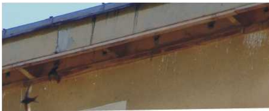
„Półeczka” pod otworami do stropodachów - ul. Okólna 7

Sprawa jest priorytetowa. Należy ją bezwzględnie wykonać przed okresem lęgowym jerzyków 2007.