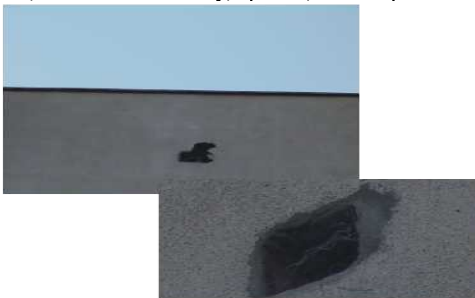
Otwór - pułapka