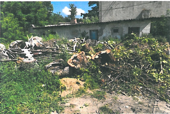
Rysunek drewno ze ściętych drzew na terenie Milanówka