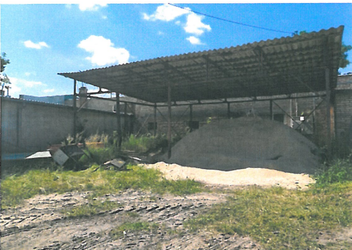
Rysunek wiata garażowa pod którą znajduje się piach z solą na zimę