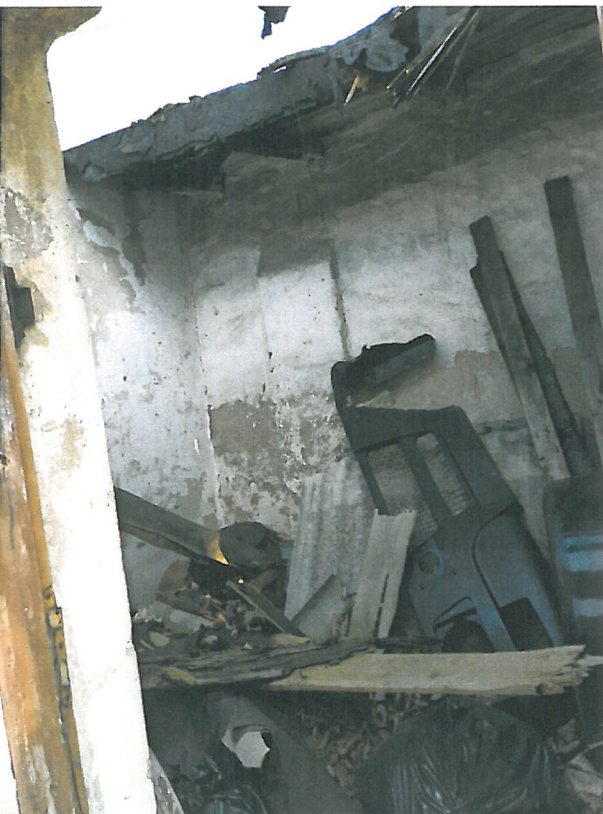
Rysunek wnętrze jednej komórki