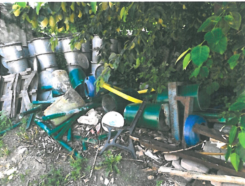
Rysunek kosze na śmieci, które zostały podmienione na nowe