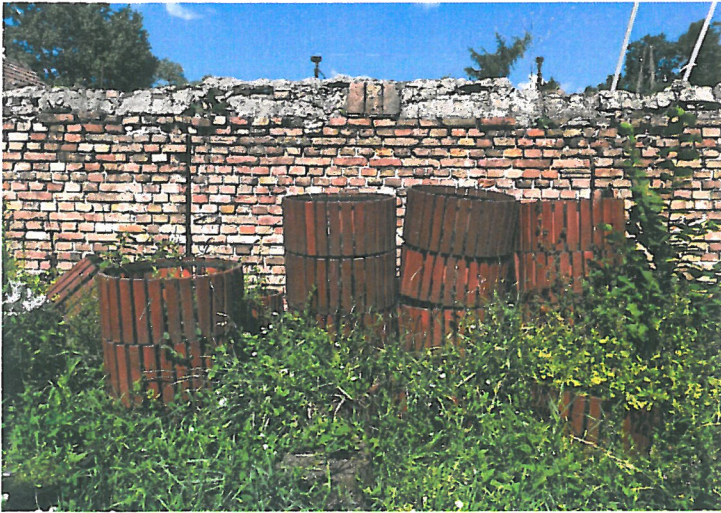
Rysunek donice miejskie z różnymi defektami