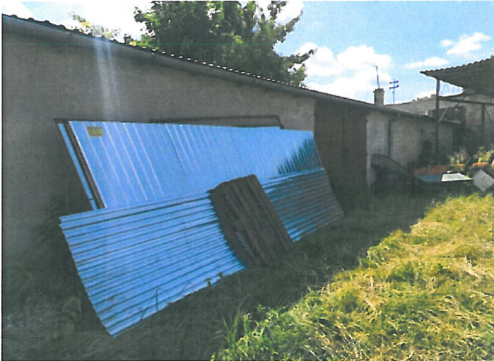
Rysunek blacha oparta o pomieszczenie magazynowe hufca ZHP Milanówek

Z informacji które dostaliśmy od pana xxx wynika, że harcerze z hufca ZHP Milanówek wynajmują jeden magazyn na własne potrzeby. Przedmioty nie mieszające się wewnątrz, a należące do harcerzy są magazynowane na zewnątrz.