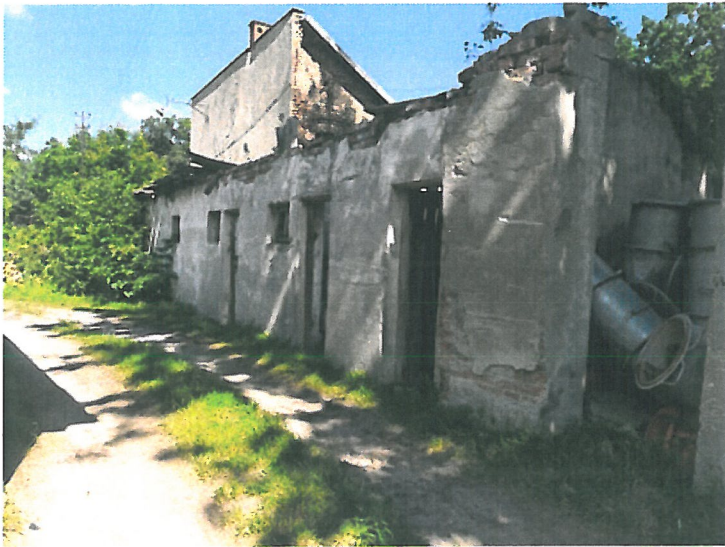
Rysunek komórki na terenie bazy sprzętu ZGKiM