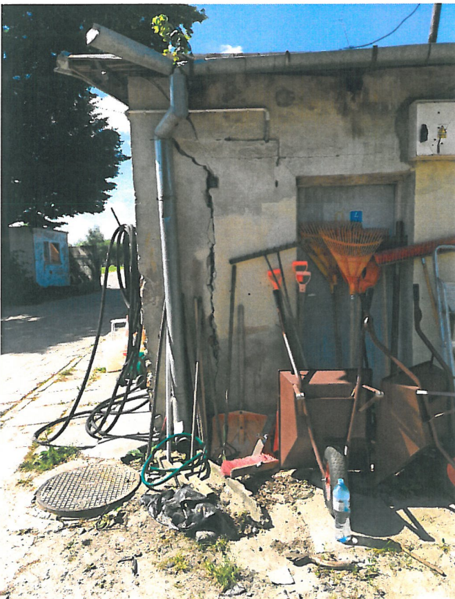
Rysunek pęknięcie wzdłuż ściany