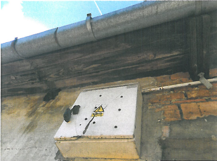
Rysunek brak kawałka więźby dachowej

Na całym podwórku panował nieporządek i nie wszystko było prawidłowo zabezpieczone. Nowe ławki zakupione przez ZGKiM w dniu kontroli stały bez zabezpieczenia przed czynnikami atmosferycznymi.