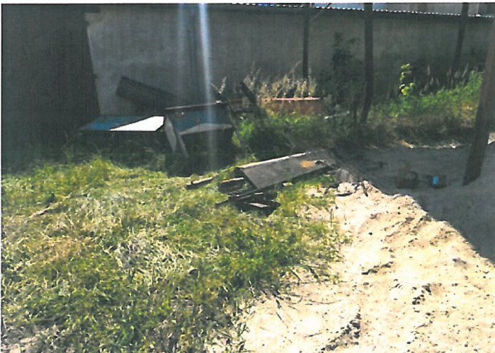
Rysunek metalowe elementy stojące przed pomieszczeniem magazynowym hufca ZHP Milanówek