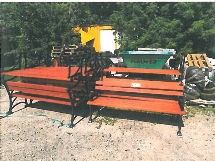
Rysunek nowe ławki z herbem Milanówka, z tyłu w czarnych workach nowe kosze na śmieci

Na całym podwórku panował nieporządek i nie wszystko było prawidłowo zabezpieczone. Nowe ławki zakupione przez ZGKiM w dniu kontroli stały bez zabezpieczenia przed czynnikami atmosferycznymi.