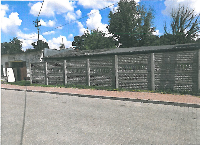
Rysunek dach budynku magazynowego od ul. Turczynek