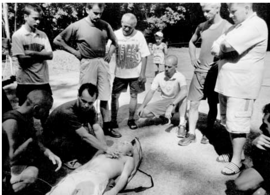
Szkolenie w Golejowie

Duży pożar wybuchł w Milanówku w nocy z szóstego na siódмого czerwca. Płonęły zabudowania gospodarcze; między innymi drewniana stodoła, garaż, obora. Bezpośrednio zagrożone były budynki mieszkalne. Nie spłonęło nic, co nie było objęte ogniem w chwili przyjazdu straży. Strażacy zadbali