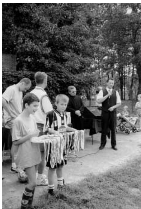
Ceremonia wręczenia nagród

Pokażmy, że potrafimy zorganizować siebie i innych w działaniach na rzecz tak ważnej sprawy jaką jest ochrona środowiska.