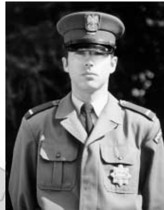
st. post. Robert NERYNG