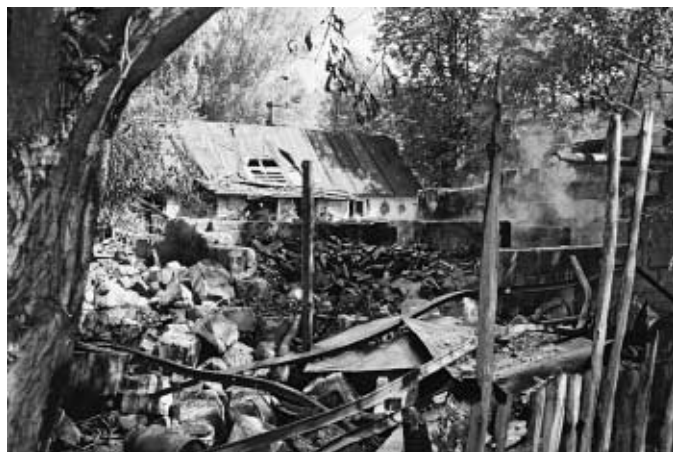
Pożar w Czarnym Lesie

Trzy dni później 10 lipca w Czarnym Lesie wybuchł największy pożar, z jakim przyszło nam walczyć w tym roku. Paliło się kilka zabudowań gospodarczych całkowicie wypełnionych różnymi przedmiotami, będącymi wynikiem wieloletnich przeszukiwań miejsc, w których inni ludzie zostawiają urządzenia już im niepotrzebne. Podwórce pomiędzy budynkami było wielkim składowiskiem gratów i rupieci. Składowisko miejscami miało wysokość dwóch metrów. W chwili przyjazdu pierwszych jednostek z PSP z Grodziska Maz., wszystko to stało