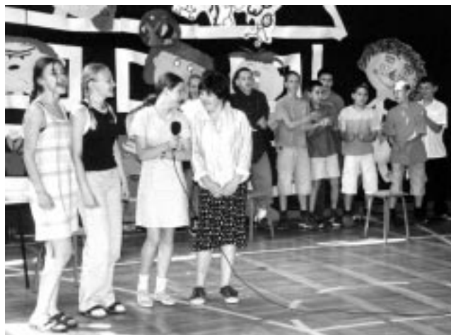
Dzieci ze Szkoły Podstawowej nr 2 w stylizowanym na Pana Tadeusza przedstawieniu przygotowanym przez Annę Gnap