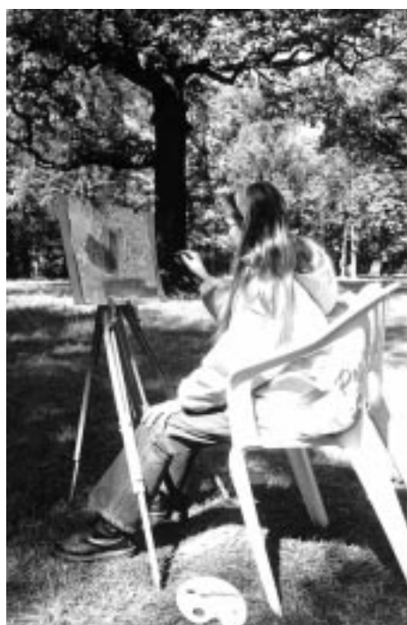
Dzieci ze Szkoły Podstawowej nr 2 podczas Warsztatów Twórczych TMM