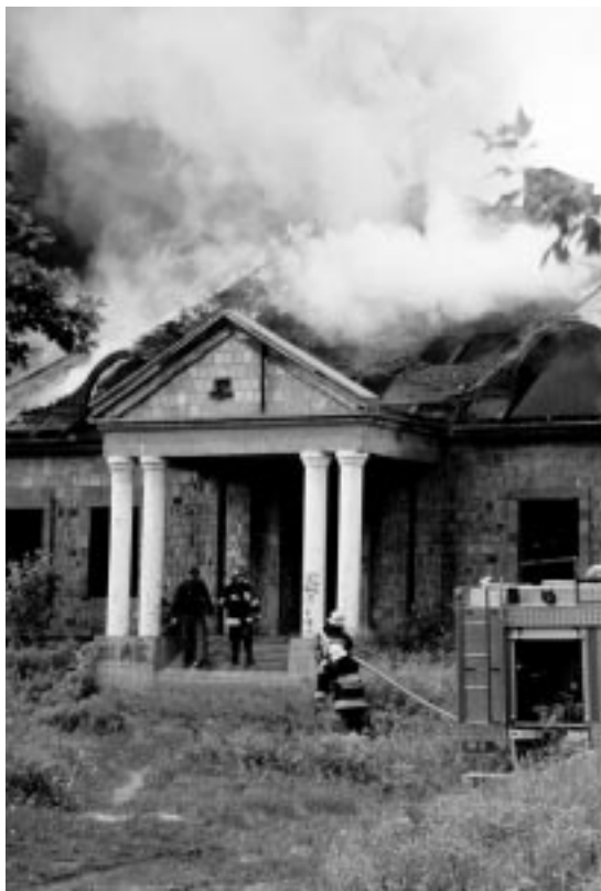
Akcja gaszenia pożaru w pustostanie na granicach Milanówka i Grodziska Maz.; W akcji uczestniczyło kilka jednostek gaśniczych