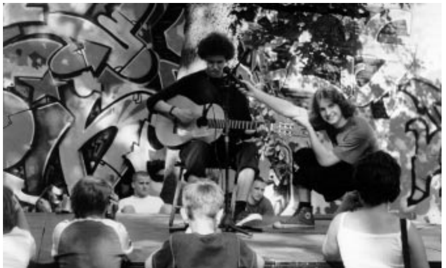
Młodzież licealna w kabaretowym popołudniu