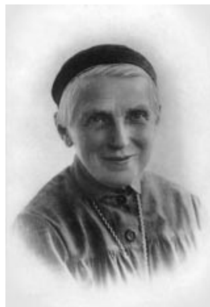
Św. Urszula Ledóchowska (1865-1939)

Ze zbioru myśli św. U. Ledóchowskiej Zgromadzenia Sióstr Urszulanek SJK