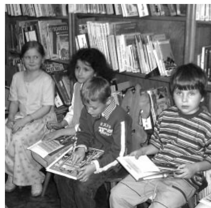
Już od wielu lat Miejska Biblioteka Publiczna organizuje konkursy recytatorskie, zachęcając dzieci do fascynowania się literaturą książek