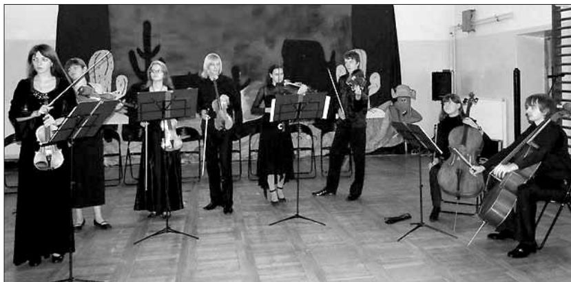
Koncert Szkolnej Kameralnej Orkiestry Smyczkowej ze Lwowa

ukraińskiej i światowej klasyki, czarując widownię mistrzowską grą, wdziękiem scenicznym i autentyzmem swego talentu. Owacja na stojąco i wielokrotne bisy to z serca płynące podziękowania za przeniesienie w fascynujący wielki świat muzyki i cudownego brzmienia skrzypiec oraz ludzkiego głosu. Komentarze po koncercie można było zamknąć w słowach: zachwyt, euforia, oczarowanie, podziw, szacunek. Uczniowski koncert z sercem na dłoni to najlepszy prezent dla ludzi zawodowo związanych ze szkołą i oświatą. Dziękujemy Panu Burmistrzowi Jerzemu Wysockiemu za ten szczególny prezent przygotowany na ten jedyny w roku dzień.