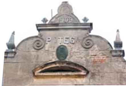
Fragment nagrodzonej prezentacji pt. „Willa Potęga – umierające piękno Milanówka”, wykonanej przez uczennicę ZSG nr 1 w Milanówku