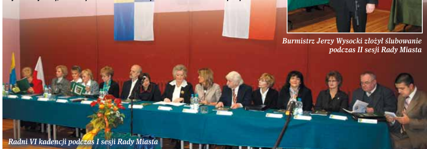
Radni VI kadencji podczas I sesji Rady Miasta