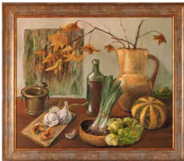
Jedna z prac prezentowanych podczas wystawy

Jest w tych obrazach zawarta prawda o niepowtarzalności chwili, zatrzymany na płótnie czas, te przedmioty za-