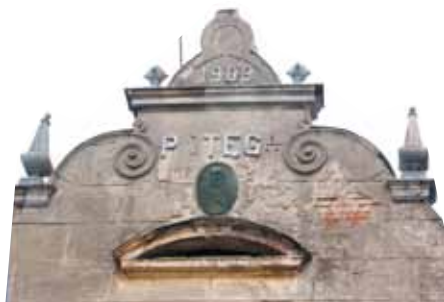
Fragment nagrodzonej prezentacji pt. „Willa Potęga – umierające piękno Milanówka”, wykonanej przez uczennicę ZSG nr 1 w Milanówku