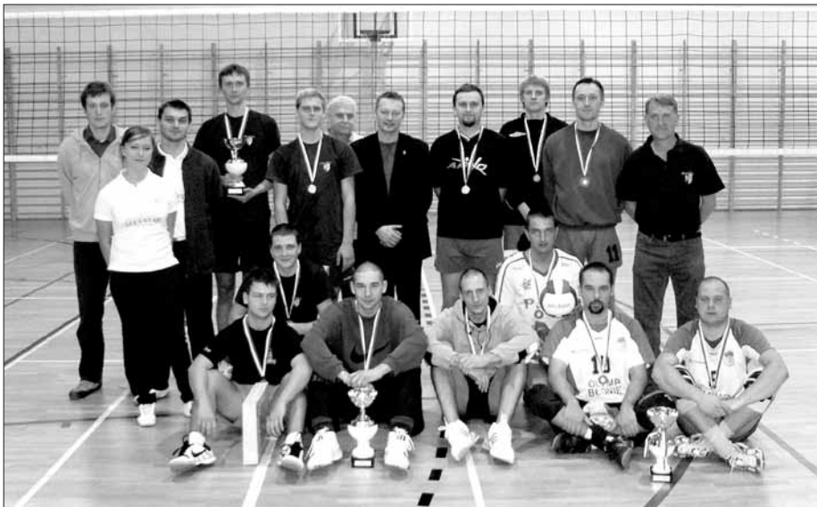
Trud i rywalizacja fair play zostały nagrodzone